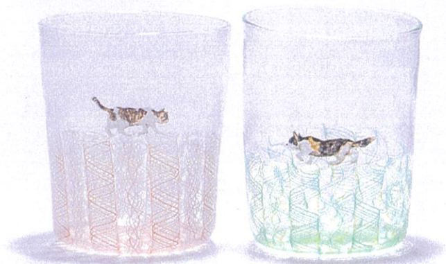
「犬猫グラス」 各 φ7×h9cm