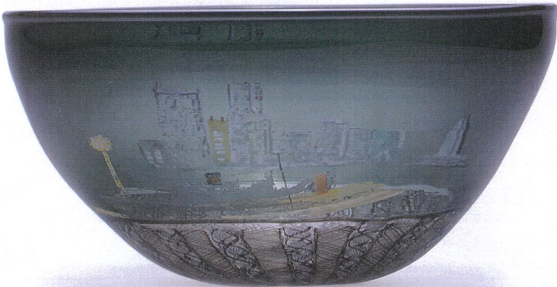
「始まりの街」平鉢 \phi 21 \times h 12 \text{cm}