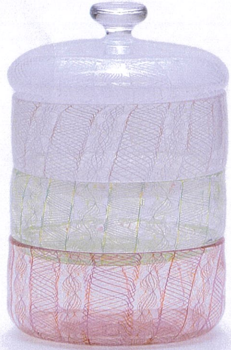
(左)「春の野山」三段重 \phi 12 \times h 17.5 \text{cm} (右)「草原」三段重 \phi 12.5 \times h 18.5 \text{cm}