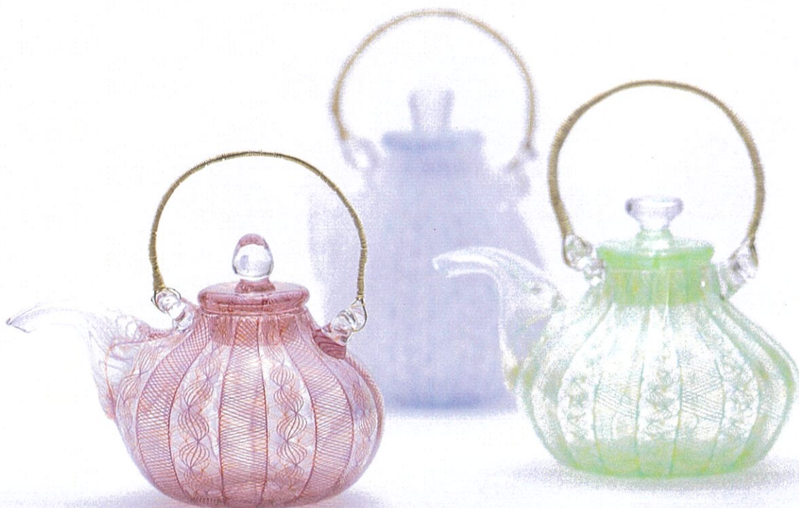
(左)「莓」ちろり w12×d8×h12.5cm (右)「メロン」ちろり w12.8×d9.8×h13.2cm (中)「オールマイティ」ちろり w11.5×d6×h14.5cm